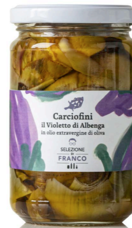
CARCIOFINO VIOLETTO DI ALBENGA In Olio Extravergine di Oliva Codice 46438 Formato 314 g x 6 pz.