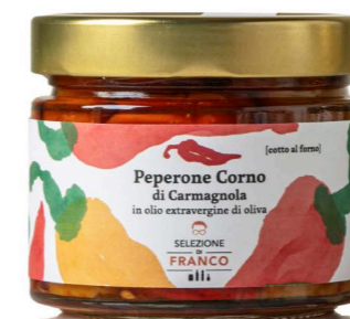
PEPERONE CORNO DI CARMAGNOLA In Olio Extravergine di Oliva Codice 89174 Formato 310 g x 6 pz.