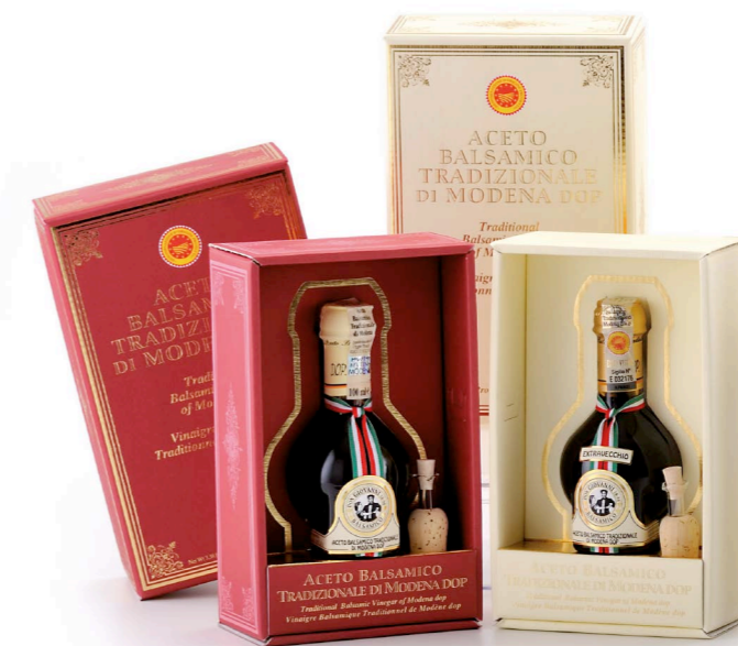
L'ACETO BALSAMICO TRADIZIONALE DI MODENA D.O.P. Cofanetto con dosatore in vetro

Don Giovanni è un'azienda sinonimo di tradizione, storia e passione di una famiglia che da oltre quattro generazioni si dedica con amore all'invecchiamento del Balsamico di Modena. Secondo la tradizione, la raccolta delle uve è ancora eseguita a mano, selezionando i grappoli migliori di Trebbiano e Lambrusco . Il mosto, cotto e concentrato in grandi caldaie di acciaio, viene posto a fermentare in grandi botti, dove comincia il processo di acetificazione. L'invecchiamento del prodotto ha luogo in piccole botti di legni pregiati (rovere, castagno, ciliegio, gelso, ginepro e frassino) che conferiscono colori, profumi e aromi unici all' Aceto Balsamico Tradizionale di Modena .