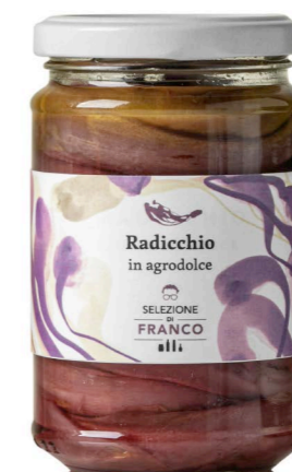
RADICCHIO In agrodolce Codice 98857 Formato 280 g x 8 pz.