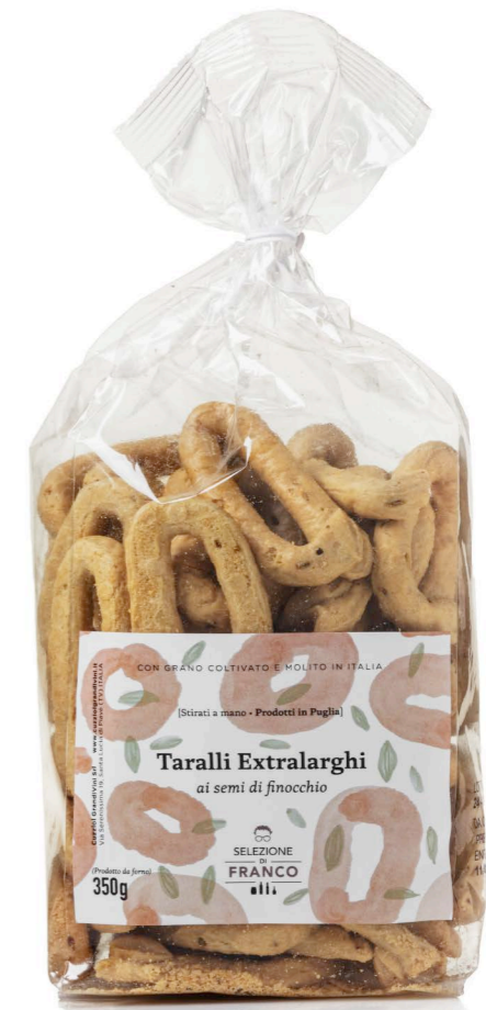
TARALLI EXTRALARGHI “AI SEMI DI FINOCCHIO” In Olio Extravergine di Oliva