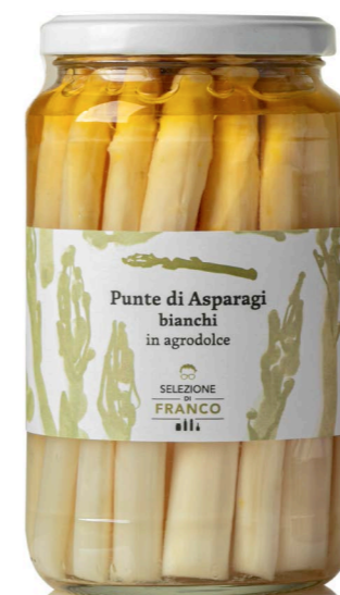
ASPARAGI BIANCHI In agrodolce Codice 12578 Formato 530 g x 6 pz.

Le prime testimonianze di utilizzo della tecnica agrodolce provengono dall'Antica Persia, dove il succo fermentato di melagrana, dal sapore dolce ed acidulo , veniva comunemente utilizzato in cucina. La combinazione di acidi e zuccheri, oltre a creare un piacevole contrasto al palato, costituisce fin da tempi antichi una tecnica diffusa di conservazione degli alimenti: sia l'aceto che lo zucchero sono infatti degli ottimi conservanti naturali. Tutti i prodotti sono confezionati con la massima cura ed attenzione: gli ortaggi provengono solo da piccole aziende agricole collocate nelle migliori aree vocate d'Italia. Non viene fatto uso di conservanti ma si applicano soltanto metodi naturali, tali da garantire la genuinità e la conservazione del prodotto.