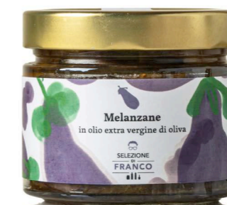
MELANZANE In Olio Extravergine di Oliva Codice 89175 Formato 310 g x 6 pz.