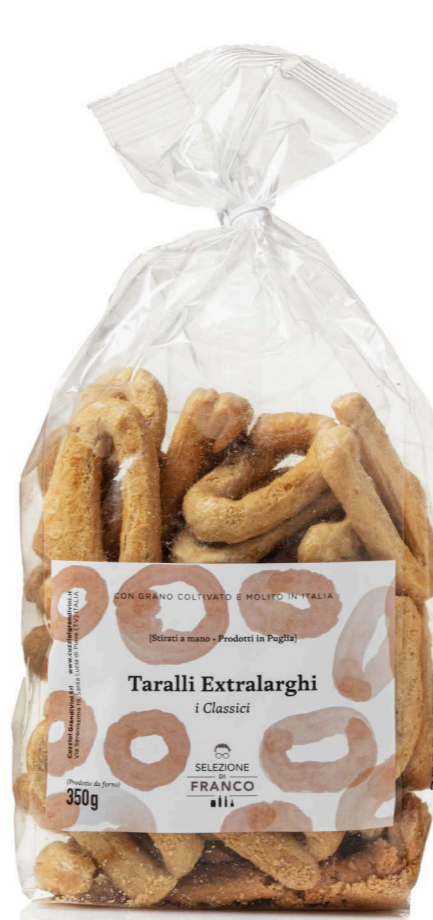
TARALLI EXTRALARGHI “I CLASSICI” In Olio Extravergine di Oliva

Taralli realizzati secondo la ricetta tradizionale Pugliese con grano coltivato e molito in Italia . Anelli ovalizzati formati e stirati rigorosamente a mano , di consistenza croccante all'esterno e grana friabile all'interno. Nella versione classica, dal profumo tipico di Olio Extravergine di Oliva oppure arricchiti dalle note balsamiche dei semi di finocchio.