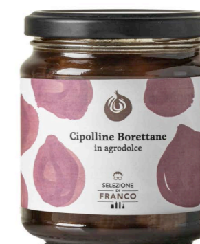
CIPOLLINE BORETTANE In agrodolce con Aceto Balsamico di Mdoena IGP Codice 49330 Formato 280 g x 6 pz.