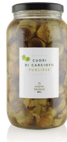
CUORI DI CARCIOFO PUGLIESE Sott'olio Misura 3 / da 60 mm Codice 41200 Formato 2750 g x 2 pz.

Gli ortaggi sott'olio della nostra collezione arrivano da aziende agricole selezionate, alcune delle quali certificate in agricoltura biologica. Tutti i prodotti sono lavorati a perfetta maturazione, seguendo le ricette della tradizione e facilmente abbinabili con le pietanze del quotidiano. Talvolta alcune lavorazioni vengono "reinventate" per offrire un prodotto più leggero e digeribile. Ortaggi a km 0 , sempre prodotti e lavorati nella stessa area, con grande attenzione alla materia prima, come il carciofo violetto di Albenga, i peperoni cornetti o le melanzane.