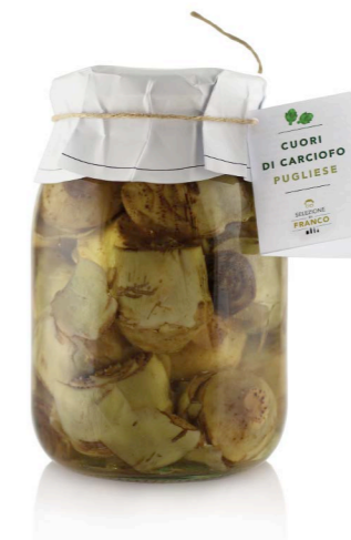
CUORI DI CARCIOFO PUGLIESE Sott'olio Misura 2 / da 55 mm Codice 41201 Formato 960 g x 6 pz.