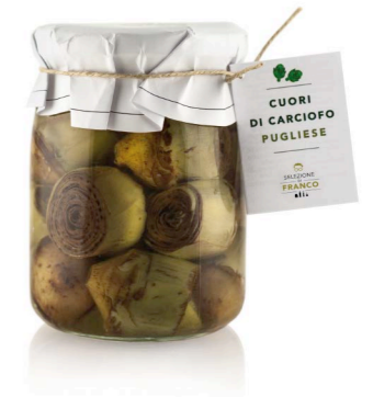
CUORI DI CARCIOFO PUGLIESE Sott'olio Misura 0 / da 45 mm Codice 41202 Formato 520 g x 6 pz.